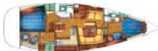
Plan d'aménagement - version 2 cabines 2 cabins version 2 kabinen version