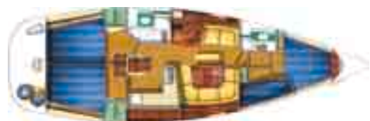
Plan d'aménagement - version 4 cabines 4 cabins version 4 kabinen version