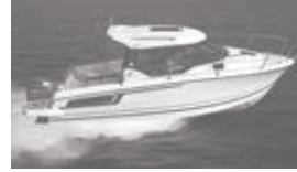
Merry Fisher 795