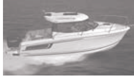
Merry Fisher 695