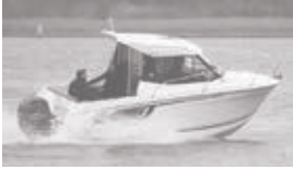
Merry Fisher 605