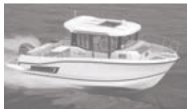
Merry Fisher 795 marlin