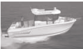
Merry Fisher 695 marlin