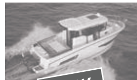
Merry Fisher 875 marlin